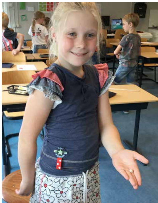
Kijk, ik heb een parel

handig rekenen, tafels gebruiken en spronggewijs tellen. Het moeilijkste vonden de leerlingen de bepaling van de strategie en of deze wel handig gekozen was.